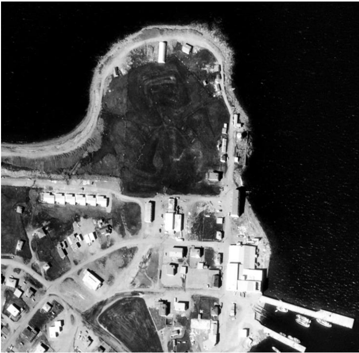
Loftmynd frá 1983