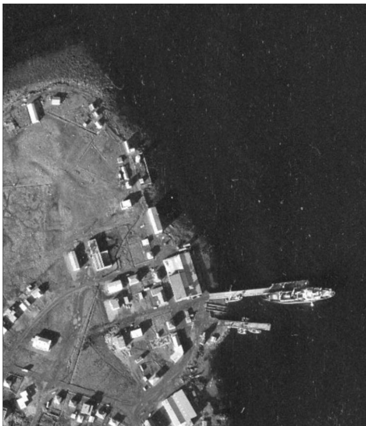
Loftmynd frá 1974