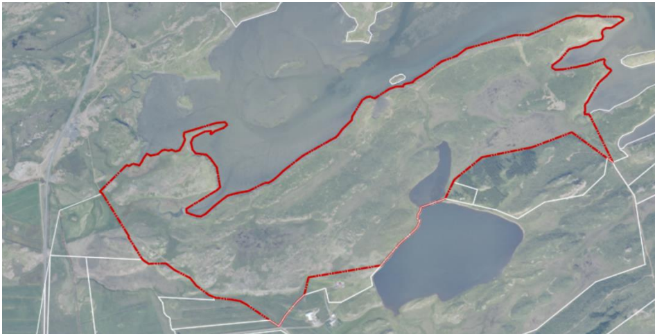
Mynd 1: Skipulagssvæðið við Vigráfjörð.

Breiðafjarðarnefnd veltir fyrir sér hvar innan deiliskipulagssvæðisins sé gert ráð fyrir uppbyggingu. Áætlað byggingarmagn á deiliskipulagssvæðinu er 2,1 ha á landi sem er 134,5 ha. Staðsetning bygginga innan skipulagssvæðisins gæti gefið vísbendingar um möguleg áhrif á verndarsvæði Breiðafjarðar, sem er verndað samkvæmt lögum nr. 54/1995 um vernd Breiðafjarðar 1 . Verndarsvæðið nær yfir fjörur við skipulagssvæðið og leggur nefndin áherslu á að fjörum verði ekki spillt í nánari útfærslu skipulagsins.