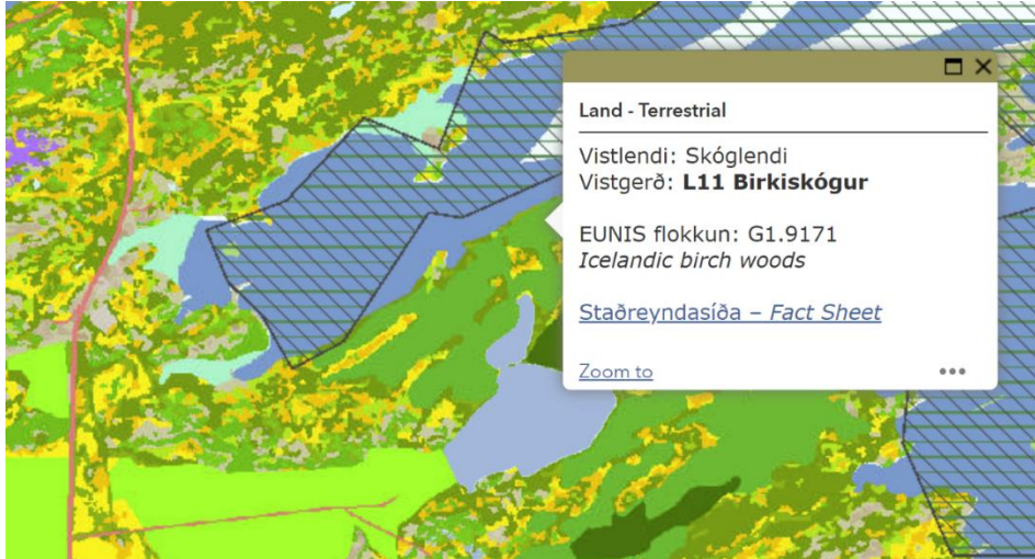
Mynd 2: Kjarrskógavist (L11) á skipulagssvæði samkvæmt vistgerðakorti Náttúrufræðistofnunar Íslands.

Margar tilgreindar vistgerðir á skipulagssvæðinu eru með hátt eða mjög hátt verndargildi samkvæmt upplýsingum Náttúrufræðistofnunar Íslands 2 . Breiðafjarðarnefnd bendir sérstaklega á sjávarfitjar og leirur við Vigrafjörð sem eru innan verndarsvæðis Breiðafjarðar og njóta sérstakrar verndar skv. 61. gr. laga nr. 60/2013 um náttúruvernd 3 . Kafllinn tilgreinir ekki kjarrskógavist (birkiskóg) sem teygir sig yfir austurhluta skipulagssvæðisins, sbr. mynd 2. Verndargildi kjarrskógavistar er hátt og er vistgerðin