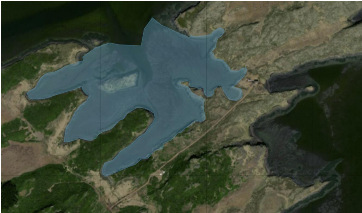
Mynd 3: Leirur milli Gæsatanga og Þingskálaness við skipulagssvæðið.

Breiðafjarðarnefnd telur að við hönnun og framkvæmdir vegna fráveitu þurfi að taka tillit til sérstakra og verndaðra vistgerða (sbr. lög nr. 60/2013), bæði á verndarsvæðinu og deiliskipulagssvæðinu öllu. Kortasjá Sveitarfélagsins Stykkishólms, sbr. mynd 4, sýnir mikilvægar leirur milli Gæsatanga og Þingskálaness.