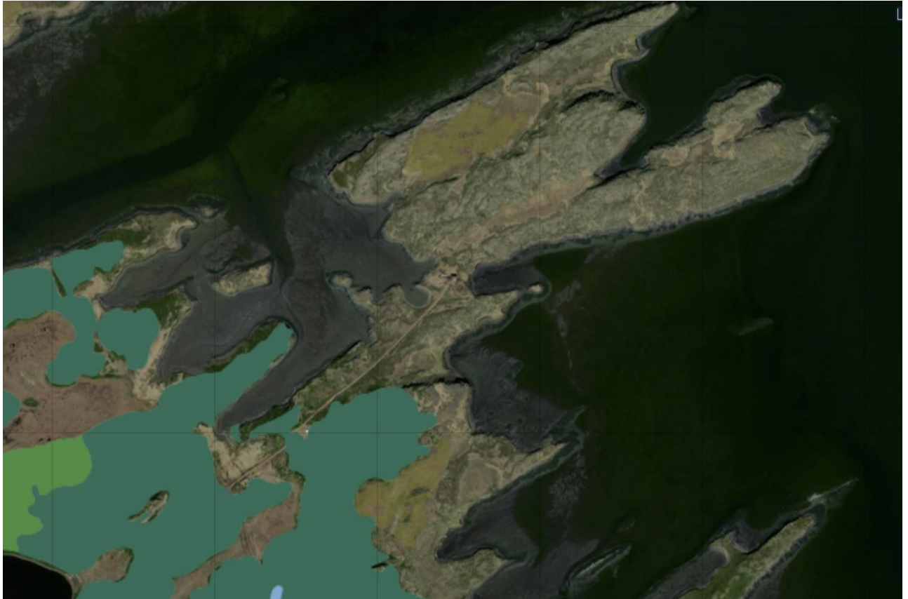
Mynd 2: Sérstök vernd tiltekinna vistkerfa skv. 61. grein náttúruverndarlaga nr. 60/2013. Birkiskógur er merktur með grænum lit og votlendi eru ljósbrún. Heimild: Vefsíða Sveitarfélagsins Stykkishólms.

Vistgerðakortið sýnir líka votlendi á svæðinu. Votlendi eru merkt með gulum lit. Það er tiltölulega erfitt að greina nákvæmlega votlendi á yfirlitsmynd Náttúrufræðistofnunnar Íslands en kortasjá Sveitarfélagsins Stykkishólms sýnir votlendi og birkiskóg vel, sbr. mynd 2. Votlendi stærri en 20.000 m 2 eru vernduð skv. 61. grein laga um náttúruvernd nr. 60/2013.