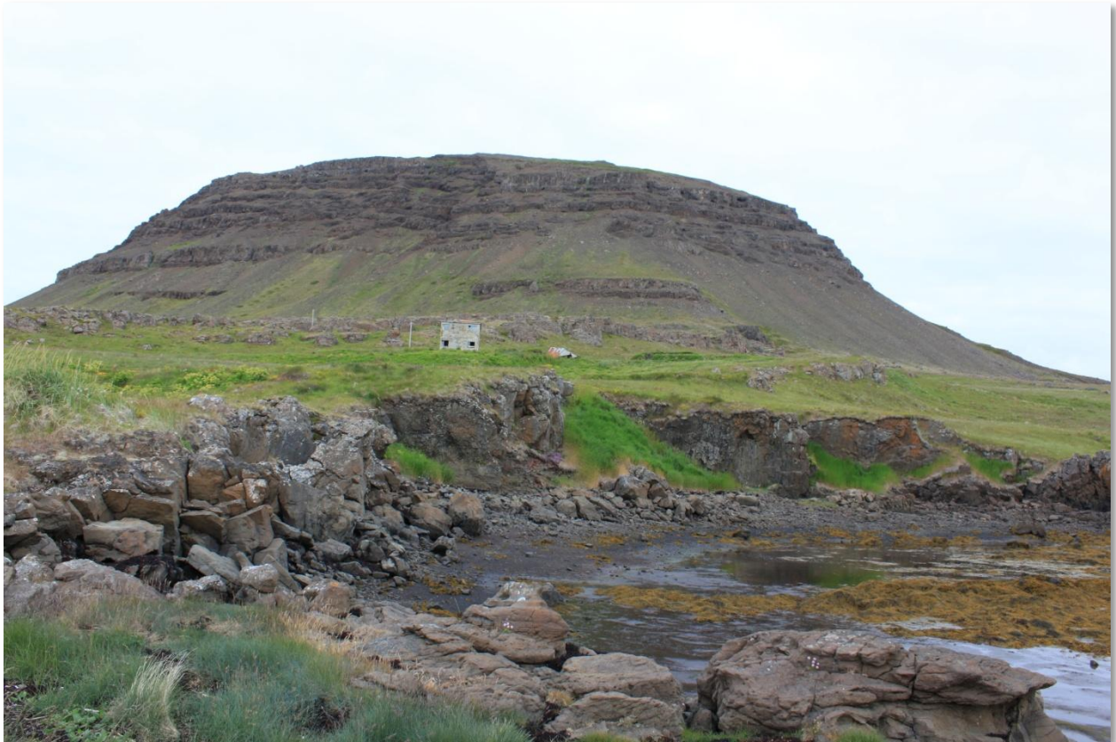
Svínanes í Múlasveit