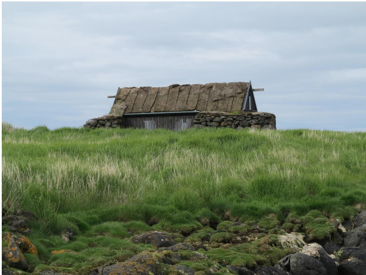
Kómetuhjallur á Miðbúðarparti í Bjarneyjum á Breiðafirði